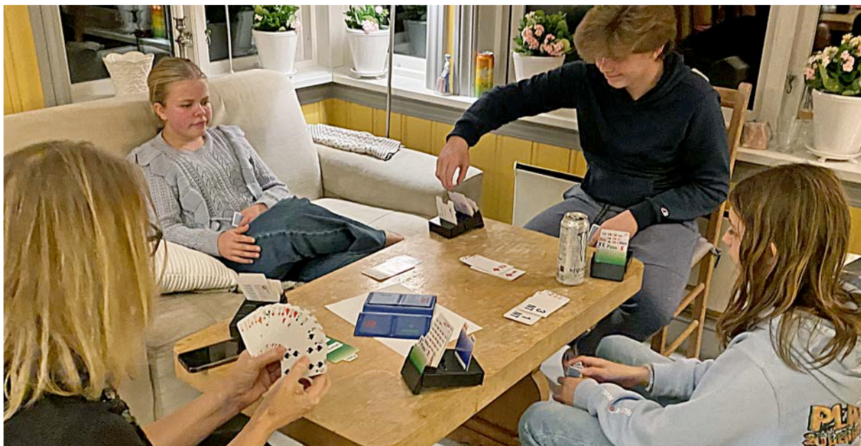
Hyttetur til Ulvik saman med Bergen Akademiske bk, september 2023