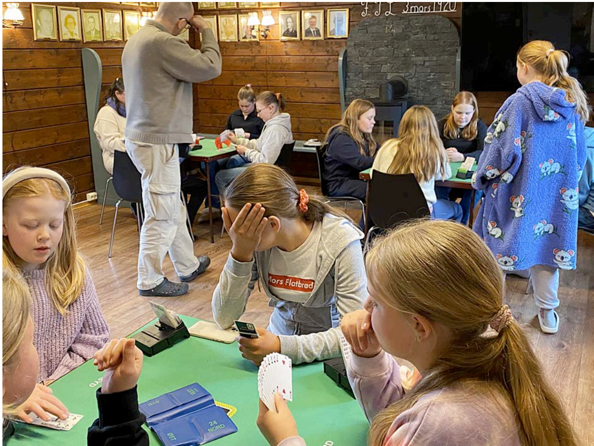
Treningsleir Fanahytten, april 2024