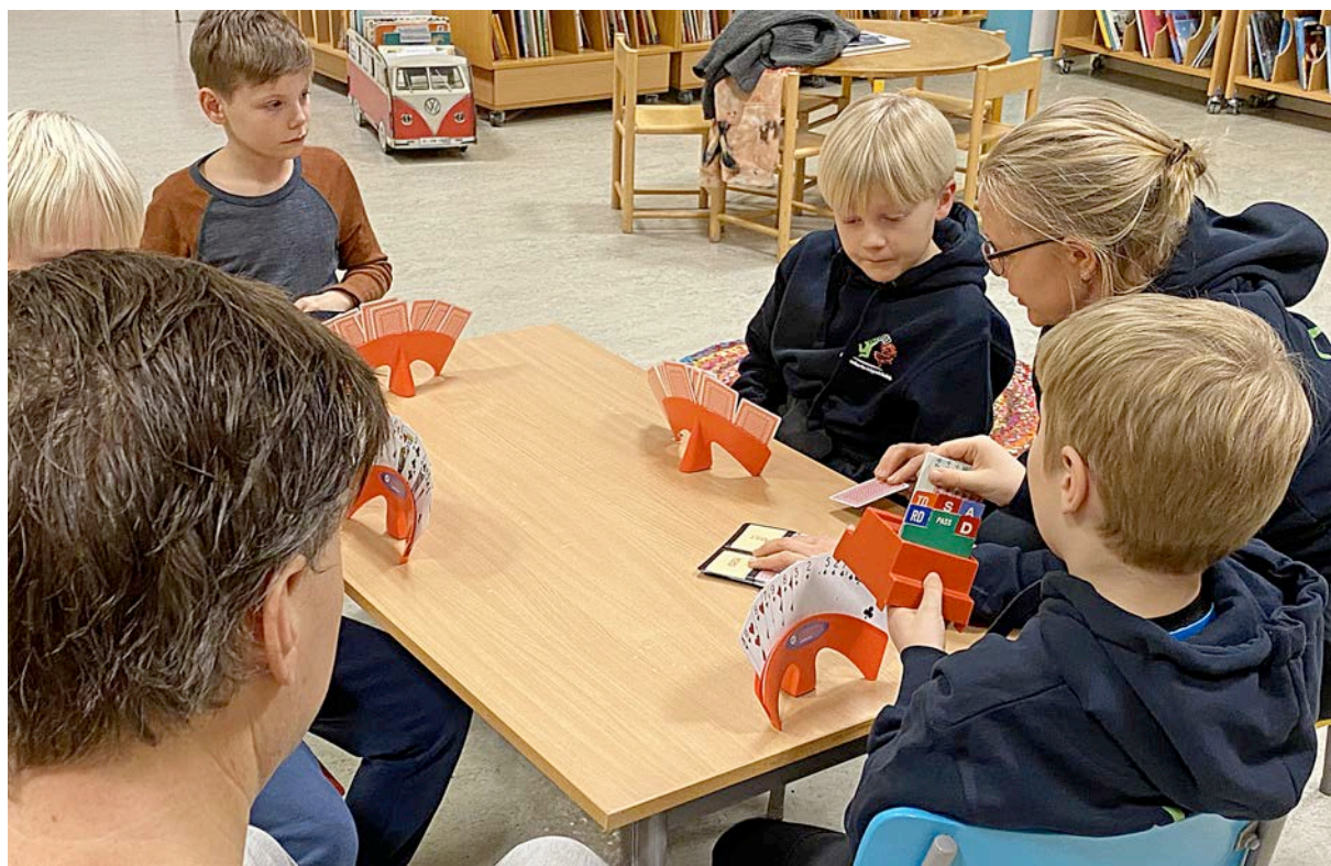
Dei yngste i aksjon på biblioteket

spelekveldane på, og Lunde Barneskule for lån av lokale til skulebridgen. Nokre bilete frå aktivitetar i klubben her: