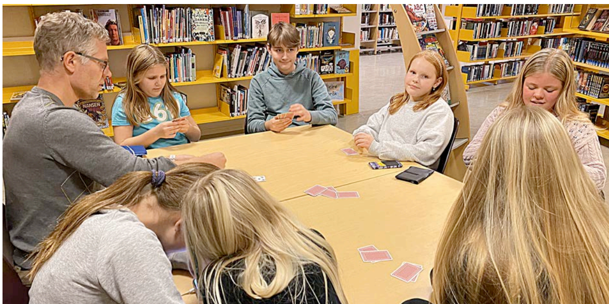
Anders og gjengen