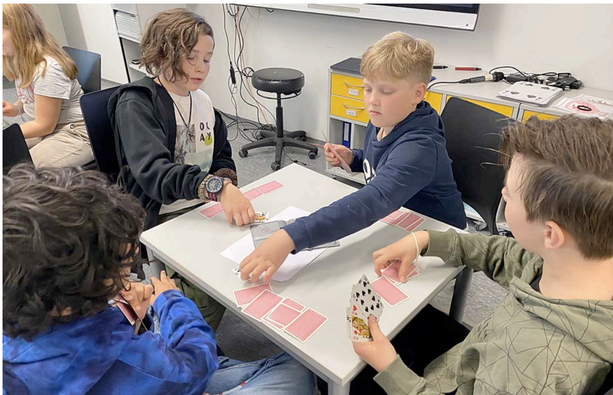
Ivrige elevar på Lunde