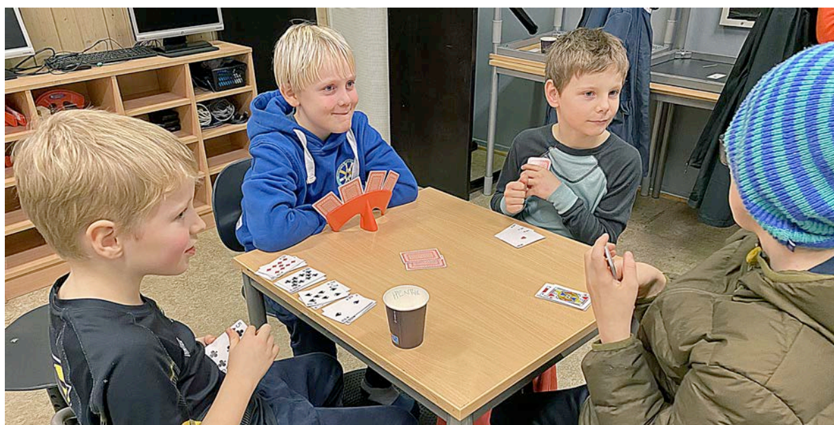
Test av "klubbhuset vårt2 på Lunde