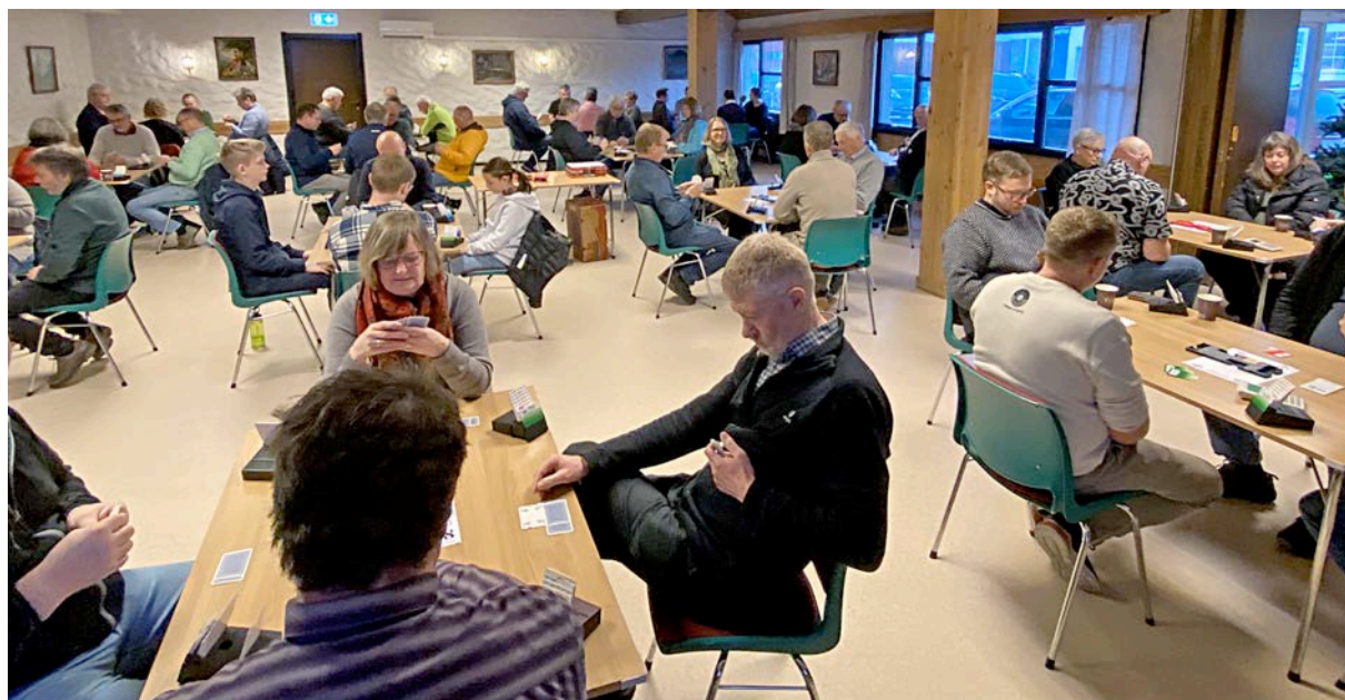
Heile 30 par deltok i juleturneringa denne gongen.