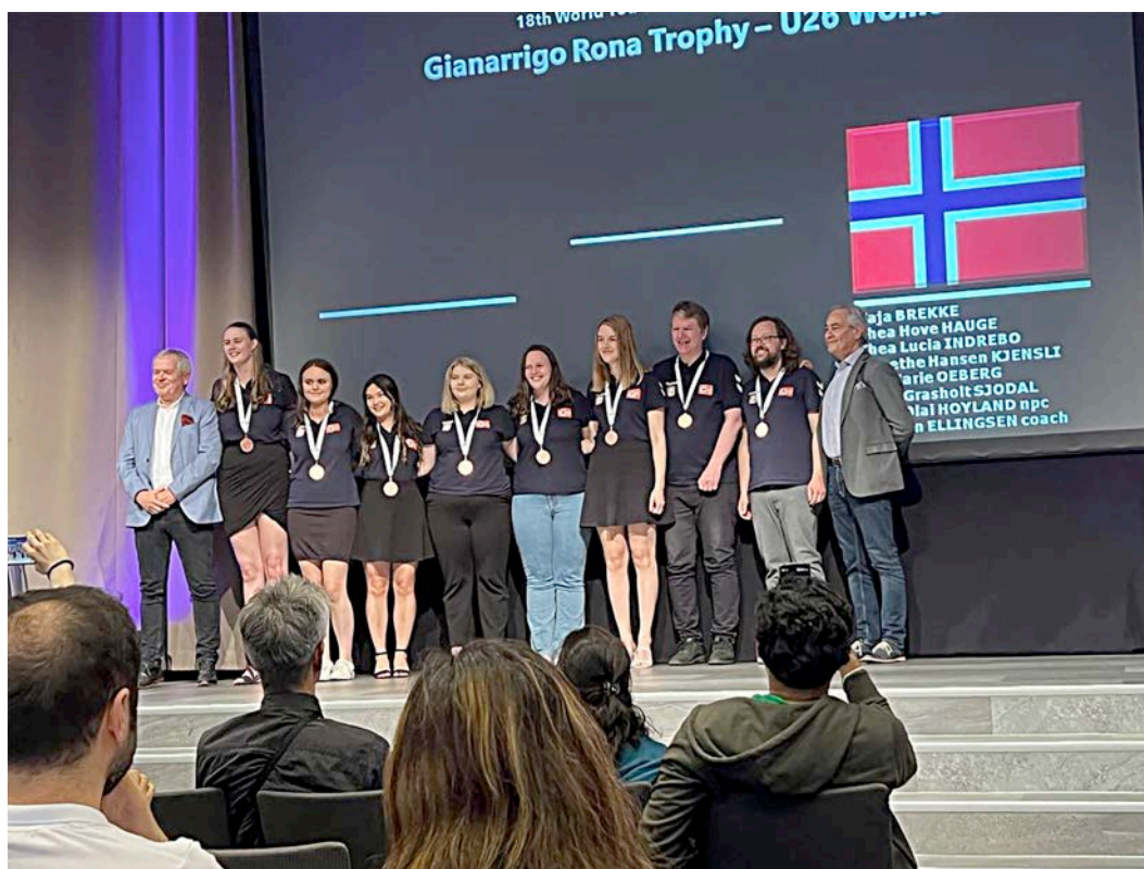
Bilete frå medaljeutdelinga