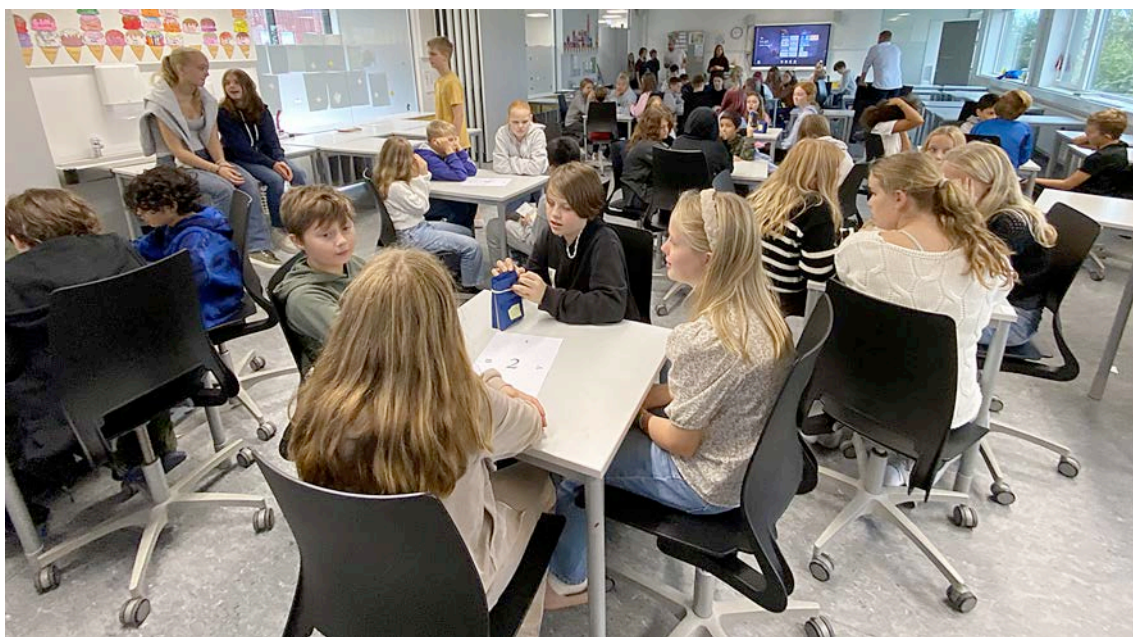
52 sjetteklasseselevar fekk prøva bridge på Lunde barneskule

Her er nokre bilete frå oppstarten på Lunde