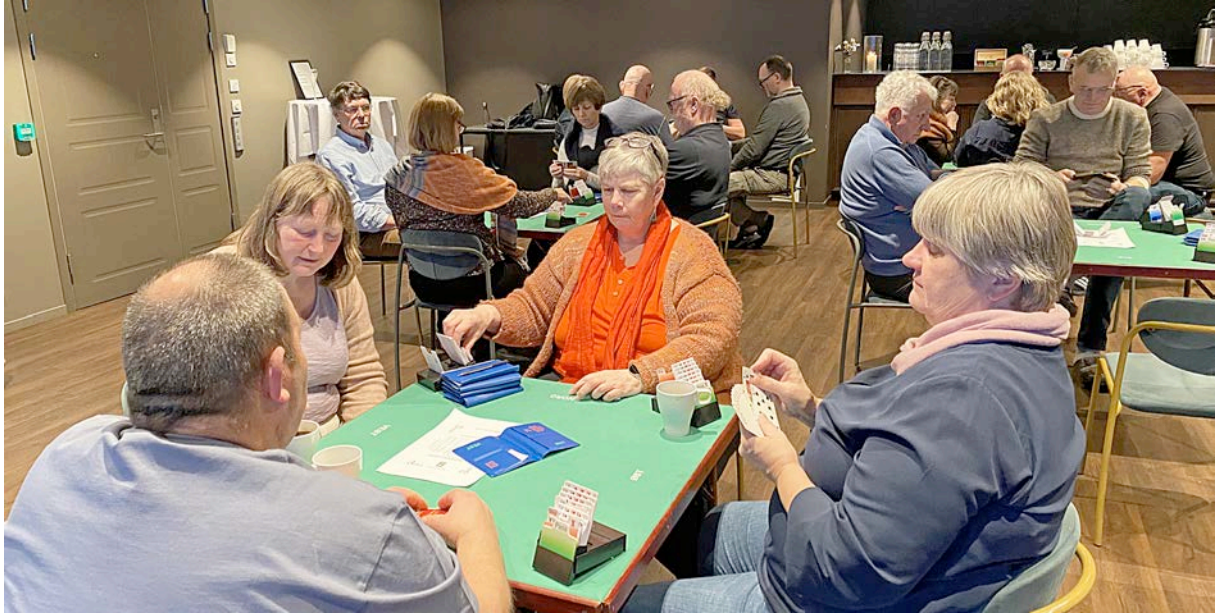
Frå salen på Herdla