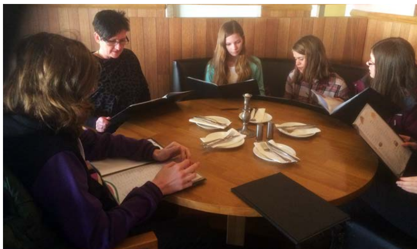
Mykje godt å velja i menyen.

Etter ca tre timar med teori og speling var det tid for mat. Sidan det var kort avstand valde vi å gå ned til Os sentrum og gå på ein av pizza-restaurantane der. Eit svært populært tiltak.