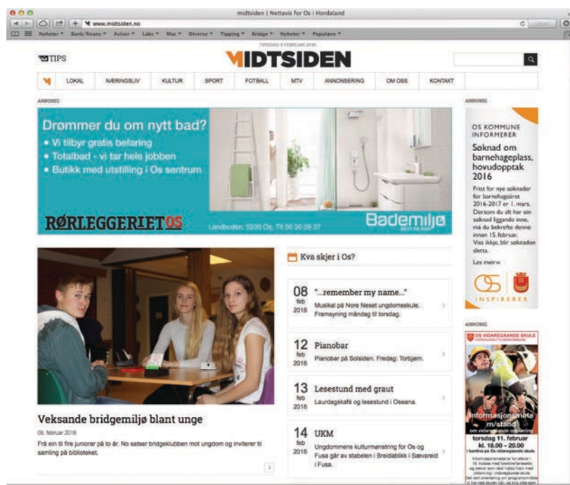
Framsida til Midtsiden 9. februar 2016.

Rett over nyttår gjekk vi i gang å annonsera kurset. I tillegg til plakatar og Facebook, satsa vi på nettannonsering på nettsidene til dei lokale media i bygda; Os og Fusaposten og Midtsiden. Midtsiden hadde òg ei redaksjonell førehandssak av kurset.